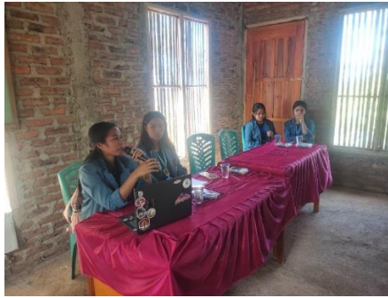
Gambar 6. Pemaparan Materi LITERASI DIGITAL: Membangun Desa Melalui Media Digital”