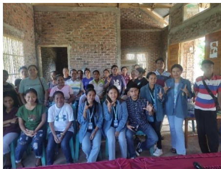
Gambar 4. Foto Bersama Masyarakat Desa Tewaowutung