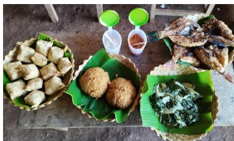
Gambar 2. Makanan yang dibuat oleh kelompok kuliner wailei

Ada beberapa manfaat dari media sosial yang bisa digunakan oleh Masyarakat Desa Tewaowutung, sbb: