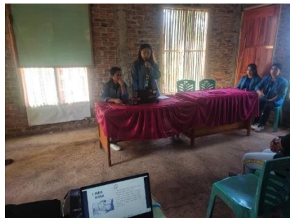
Gambar 5. Pemaparan Materi LITERASI DIGITAL: Membangun Desa Melalui Media Digital”