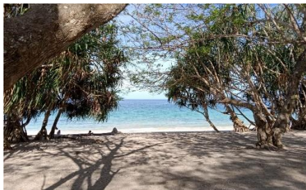
Gambar 1. Pantai Wailei, tempat wisata yang ada di Desa Tewaowutung

Pada tanggal 02 Agustus 2024, kegiatan sosialisasi “Literasi Digital: membangun desa melalui media digital” ini berisi tentang manfaat yang didapat dari media sosial bagi desa, pengemasan produk yang menarik, dan pembuatan logo dan media sosial. Materi-materi ini dipilih karena melihat dari potensi yang ada pada desa seperti halnya dengan produk yang dihasilkan pada UMKM-UMKM yang ada pada desa, pariwisata dengan Pantai yang indah yang masih kurang dalam hal promosi, dan makan khas yang ada pada desa seperti kue putu (kue yang terbuat dari singkong, kelapa dan gula merah) dan kelapa eus (kelapa yang sabuknya bisa dimakan).