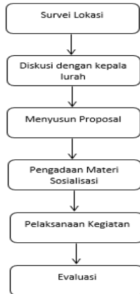
Gambar 1. Tahapan Pelaksanaan Kegiatan