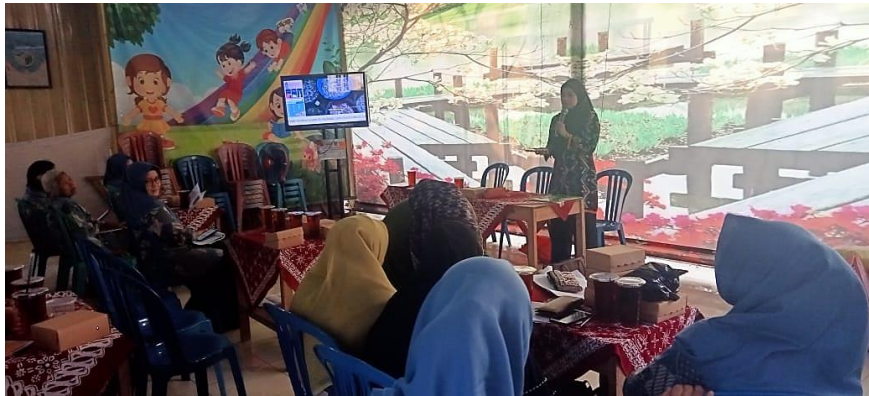
Gambar 2. Pemaparan Materi SIKONTRAS

Aktivitas sosialisasi SIKONTRAS ini dilakukan guna untuk mengoptimalkan peran para warga kelurahan Kerten dalam program keluarga berencana melalui peningkatan pengetahuan terkait macam-macam kontrasepsi dan penggunaan sistem informasi kontrasepsi rasional (SIKONTRAS) untuk pengaksesan informasi kontrasepsi.