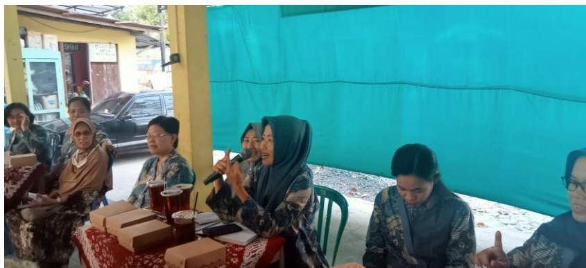
Gambar 3. Kegiatan Tanya Jawab