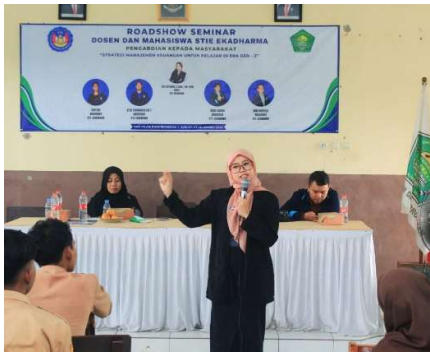
Dokumentasi Bersama Narasumber