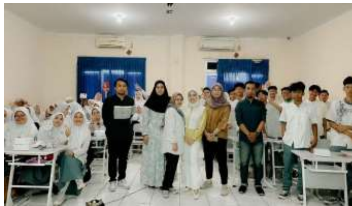
Gambar 2. Foto bersama Peserta Dengan Siswa Siswi