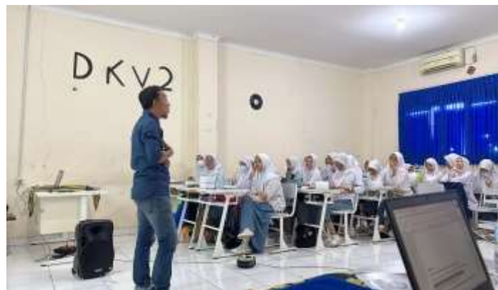
Gambar 3. Foto kegiatan sesi tanya jawab dengan salah satu Pemateri

Pada gambar 3 adalah kegiatan sesi tanya jawab, Pada kegiatan ini diberikan kesempatan untuk 5 orang pelajar untuk bertanya. Beberapa pertanyaan tersebut banyak yang menarik perhatian terhadap profesi akuntansi yaitu Auditor Internal. Dan dari salah satu dosen memberikan penjabaran lebih lanjut terhadap pertanyaan dari para siswa secara jelas, singkat, dan mudah dipahami.