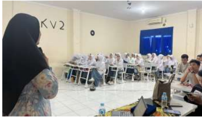
Gambar 1. Pemberian Materi Terkait Profesi Akuntansi