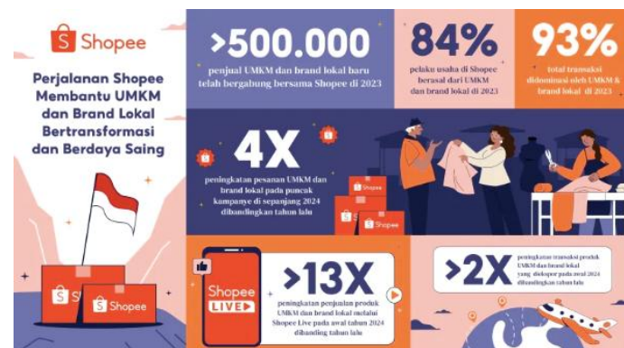
Gambar 6. Infografis Tentang Peran Shopee Dalam Membantu UMKM Dan Brand Lokal Bertransformasi, dengan Data Pertumbuhan Penjual, Transaksi, dan Penggunaan Fitur Shopee di 2023-2024

Dukungan Shopee terhadap UMKM dan brand lokal juga menjadi faktor penting dalam pertumbuhan mereka. Program-program yang meningkatkan penjualan dan jangkauan pasar membantu UMKM dan brand lokal untuk berkembang. Peningkatan total pesanan dari UMKM dan brand lokal hingga empat kali lipat selama puncak kampanye di 2024 menunjukkan keberhasilan inisiatif ini. Hal ini tidak hanya mendukung pertumbuhan ekonomi lokal tetapi juga memperkaya variasi produk di platform Shopee.