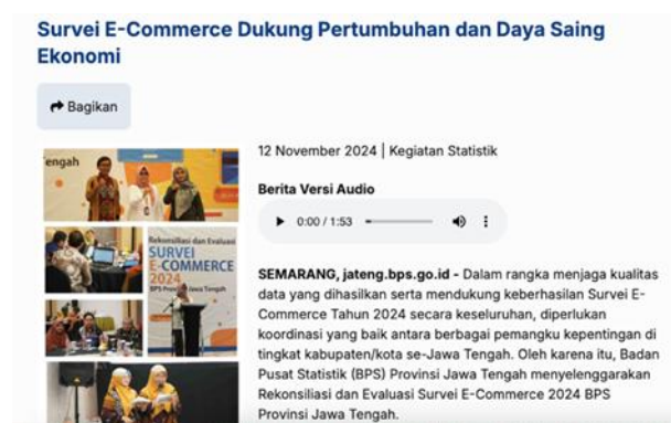
Gambar 4. Artikel tentang Survei E-Commerce 2024 oleh BPS Jawa Tengah yang Mendukung Pertumbuhan dan Daya Saing Ekonomi

Sebagai salah satu pemain utama, Shopee turut berkontribusi pada pertumbuhan pengiriman e-commerce di Indonesia melalui sistem logistik yang terus ditingkatkan. Juhana et al. (2024) mencatat bahwa Shopee terus berinvestasi dalam infrastruktur logistiknya dengan membangun lebih banyak gudang dan meningkatkan teknologi pelacakan untuk mendukung efisiensi operasional. Hingga tahun 2024, Shopee telah mengoperasikan lebih dari 15 pusat distribusi utama di Indonesia yang tersebar di kota-kota besar seperti Jakarta, Surabaya, Medan, dan Makassar. Selain itu, Shopee juga memiliki lebih dari 200 hub logistik yang berfungsi untuk mempercepat proses pengiriman ke pelanggan. Peningkatan infrastruktur ini didukung dengan teknologi pelacakan real-time, memungkinkan pelanggan untuk memantau status pesanan secara lebih akurat dan meningkatkan kepuasan mereka terhadap layanan pengiriman Shopee.