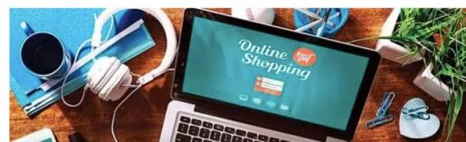
Gambar 3. Artikel Tentang Komitmen Shopee dalam Membantu Umkm Bertransformasi dan Bersaing di Awal Tahun 2024