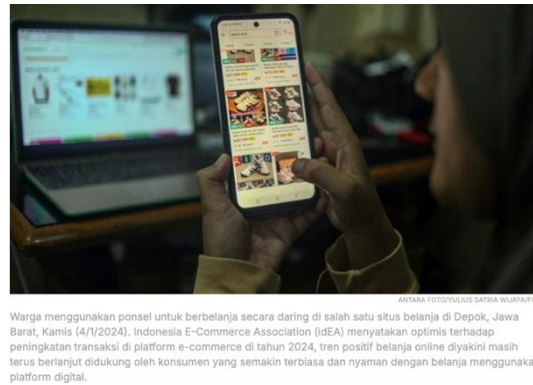
Gambar 1. Berbelanja Daring Menggunakan Ponsel dengan Latar Belakang Laptop yang Menampilkan Situs E-Commerce

Menurut laporan dari berbagai sumber yang dapat dipercaya, seperti IDXChannel, Sea Group melaporkan bahwa pendapatan Shopee menyumbang bagian terbesar dari total pendapatan perusahaan. Hingga tahun 2024, Shopee berhasil mencatatkan pendapatan sebesar USD3,2 miliar, atau sekitar 73,5 persen dari total pendapatan Sea Group. Capaian ini menunjukkan lonjakan sebesar 42 persen secara tahunan, yang menandakan keberhasilan Shopee dalam meningkatkan performa bisnisnya. Selain itu, Gross Merchandise Value (GMV) Shopee juga mengalami peningkatan sebesar 25 persen, mencapai angka USD25,1 miliar. Pertumbuhan ini mengindikasikan bahwa Shopee berhasil menarik lebih banyak transaksi, baik dari penjual maupun pembeli, melalui berbagai strategi pemasaran dan peningkatan layanan logistik yang lebih efisien.