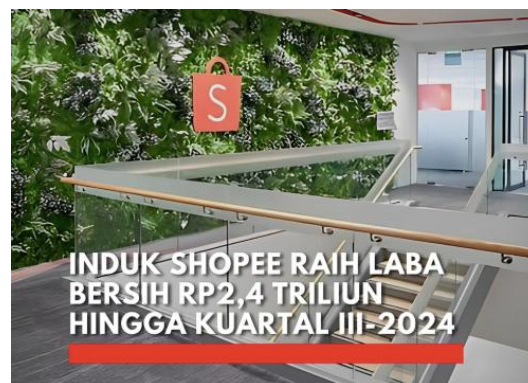
Gambar 2. Shopee Meraih Laba Bersih Rp2,4 Triliun Hingga Kuartal III Tahun 2024

Menurut laporan dari berbagai sumber yang dapat dipercaya, seperti IDXChannel, Sea Group melaporkan bahwa pendapatan Shopee menyumbang bagian terbesar dari total pendapatan perusahaan. Hingga tahun 2024, Shopee berhasil mencatatkan pendapatan sebesar USD3,2 miliar, atau sekitar 73,5 persen dari total pendapatan Sea Group. Capaian ini menunjukkan lonjakan sebesar 42 persen secara tahunan, yang menandakan keberhasilan Shopee dalam meningkatkan performa bisnisnya. Selain itu, Gross Merchandise Value (GMV) Shopee juga mengalami peningkatan sebesar 25 persen, mencapai angka USD25,1 miliar. Pertumbuhan ini mengindikasikan bahwa Shopee berhasil menarik lebih banyak transaksi, baik dari penjual maupun pembeli, melalui berbagai strategi pemasaran dan peningkatan layanan logistik yang lebih efisien.