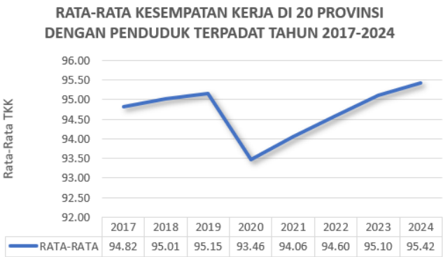
Gambar 2. Rata-Rata Kesempatan Kerja di 20 Provinsi Penduduk Terpadat Tahun 2017-2024

Berdasarkan Gambar 2, rata-rata kesempatan kerja (TKK) di 20 provinsi dengan jumlah penduduk terbanyak menunjukkan tren yang fluktuatif selama periode 2017–2024. Pada awal periode, nilai rata-rata TKK berada di angka 94,82 pada tahun 2017, kemudian meningkat secara bertahap hingga mencapai 95,15 pada tahun 2019. Namun, pada tahun 2020 tercatat penurunan signifikan hingga mencapai angka 93,46, yang diduga merupakan dampak dari pandemi COVID-19 terhadap sektor ketenagakerjaan. Setelah itu, tren TKK kembali menunjukkan peningkatan yang konsisten, yakni menjadi 94,06 di tahun 2021, 94,85 di tahun 2022, dan 95,10 di tahun 2023. Pada tahun 2024, angka TKK kembali naik ke level 95,42.